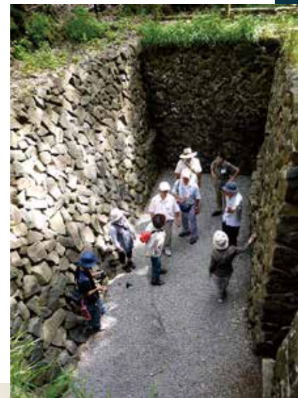
(写真 別所温泉氷沢地籍 蚕種風穴)